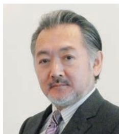
医療法人 神徳会 三田尻病院