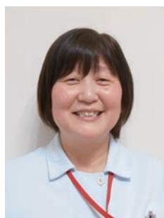
山口県厚生農業協同 組合連合会 周東総合病院