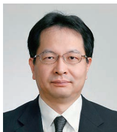
医療法人 和同会 片倉病院