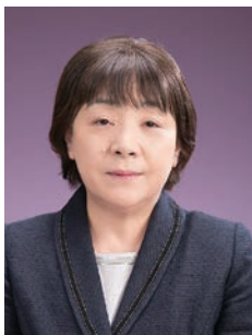
公益社団法人 山口県看護協会