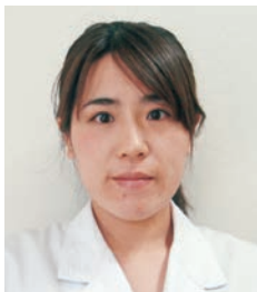
医療法人社団 千寿会 岩国第一病院 栄養部主任 管理栄養士