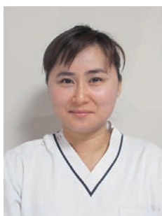
周南市立 新南陽市民病院