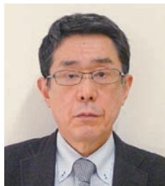
医療法人 長府病院